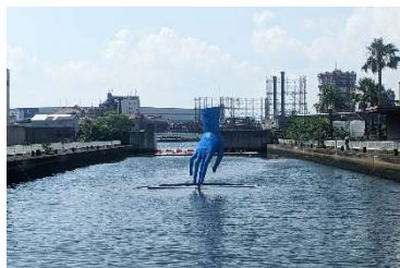
久保寛子《やさしい手》