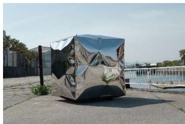
上田要《北加賀屋の空気》