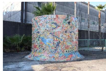
檜木野淑子《あるべきようわ、ムコの山》