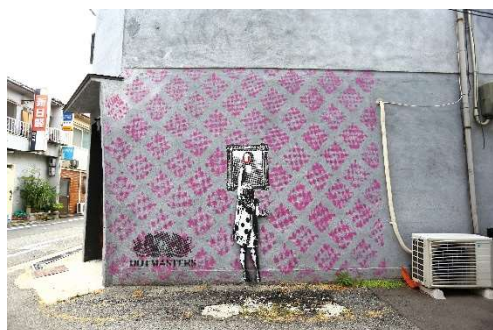
Dotmasters 《Indigo defaces Mona》