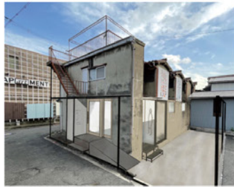
建築中のイメージ

ペット飼育可の住居区画。文化住宅の雰囲気を活かしつつ、設備面は更新し、住みよくりノベーションを施しました。アートなまちで、ペットとの新たな暮らしを始めませんか?