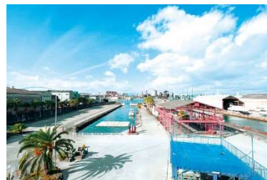
クリエイティブセンター大阪 屋外